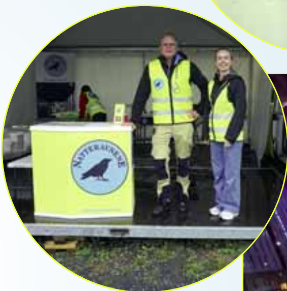
Norway Cup: Tradisjonen tro stilte Natteravnene også i år med eget telt og frivillige på Ekebergsletta under Norway Cup i månedsskiftet juli/august. Om kvelden hadde de biler som kjørte rundt på skolene der deltakerne var innkvartert for å passe på.