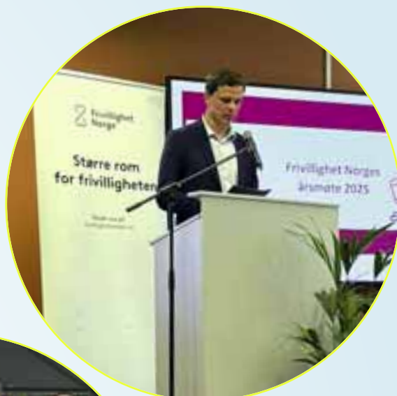
Frivillighet Norge: Den 27. mai deltok Natteravnene på årsmøtet i Frivillighet Norge. Det ble holdt i Frivillighetens hus i Oslo, der Natteravnene også har kontorer.