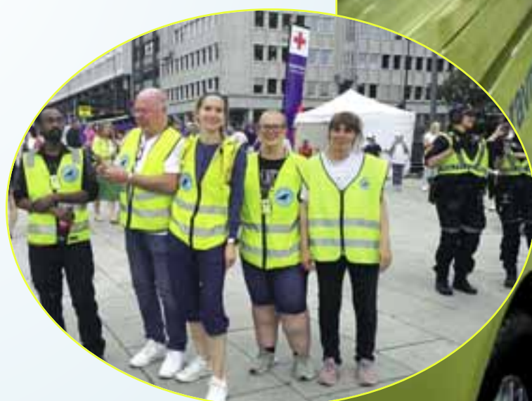
VG-lista: Natteravnene stilte som vanlig opp under gratiskonserten VG-lista, der det totalt skal ha vært rundt 50 000 mennesker på Rådhusplassen. Byen var for øvrig full av feststemte mennesker denne flotte sommerkvelden, med mye kø overalt. Etter at konserten var over kjørte Natteravnene rundt i byen og avsluttet i sentrum klokken 0430.