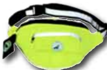
Midjetaske til for eksempel førstehjelpsutstyr