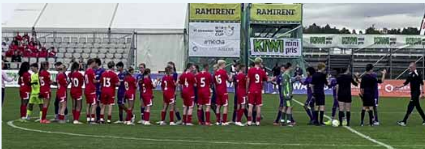
Kjernen: Vennskapskampen viser selve kjernen av Norway Cups verdier. Vennskap på tvers av nasjonalitet, kjønn, alder og kultur i én og samme kamp.