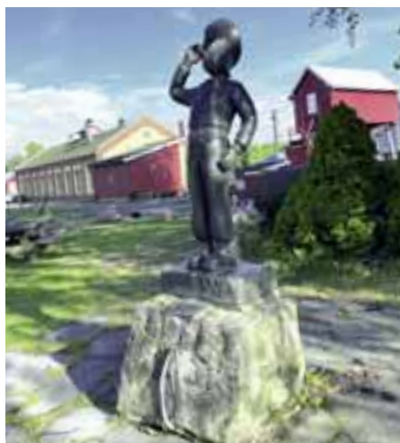
91 Stomperud: Sørumsand er et lite sted i Lillestrøm kommune i Akershus fylke. Mange kjenner det som hjemstedet til den norske utgaven av tegneseriefiguren 91 Stomperud.

Uansett er det å gå natteravn en fin anledning til å bli kjent med nabolaget sitt og hva som skjer der, enten du har bodd der lenge eller er nyinnflyttet.