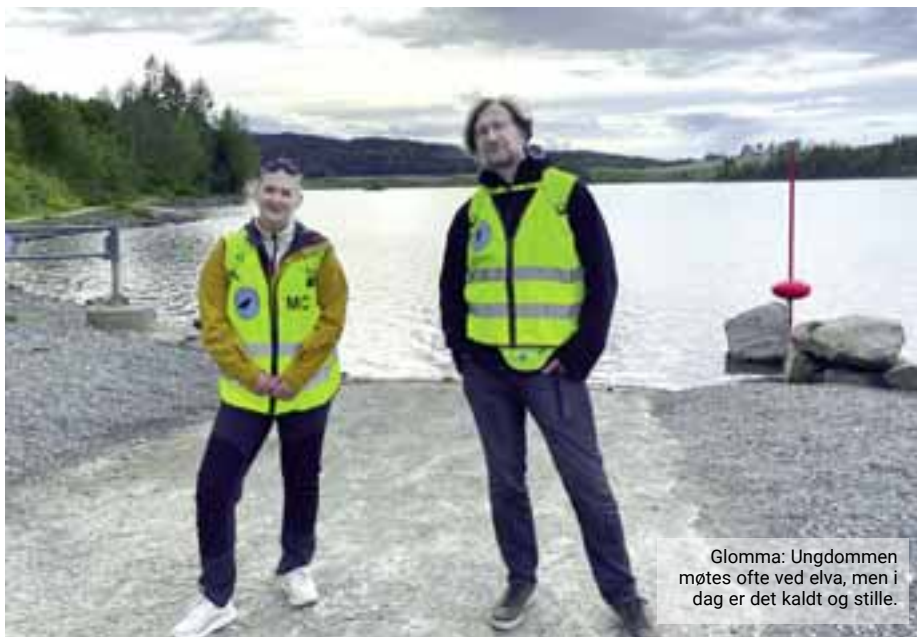
Glomma: Ungdommen møtes ofte ved elva, men i dag er det kaldt og stille.

Den nye styringsgruppen overtok listen med frivillige fra de som var ansvarlig tidligere, gikk gjennom den og ryddet litt opp. Samtidig var det ganske mange nye som meldte seg etter avisoppslaget. Resultatet ble at de nå har cirka 85 frivillige på lista, der noen går mye og andre mer sjeldent. De er likevel så mange at de stort sett greier å gjennomføre vandringene.