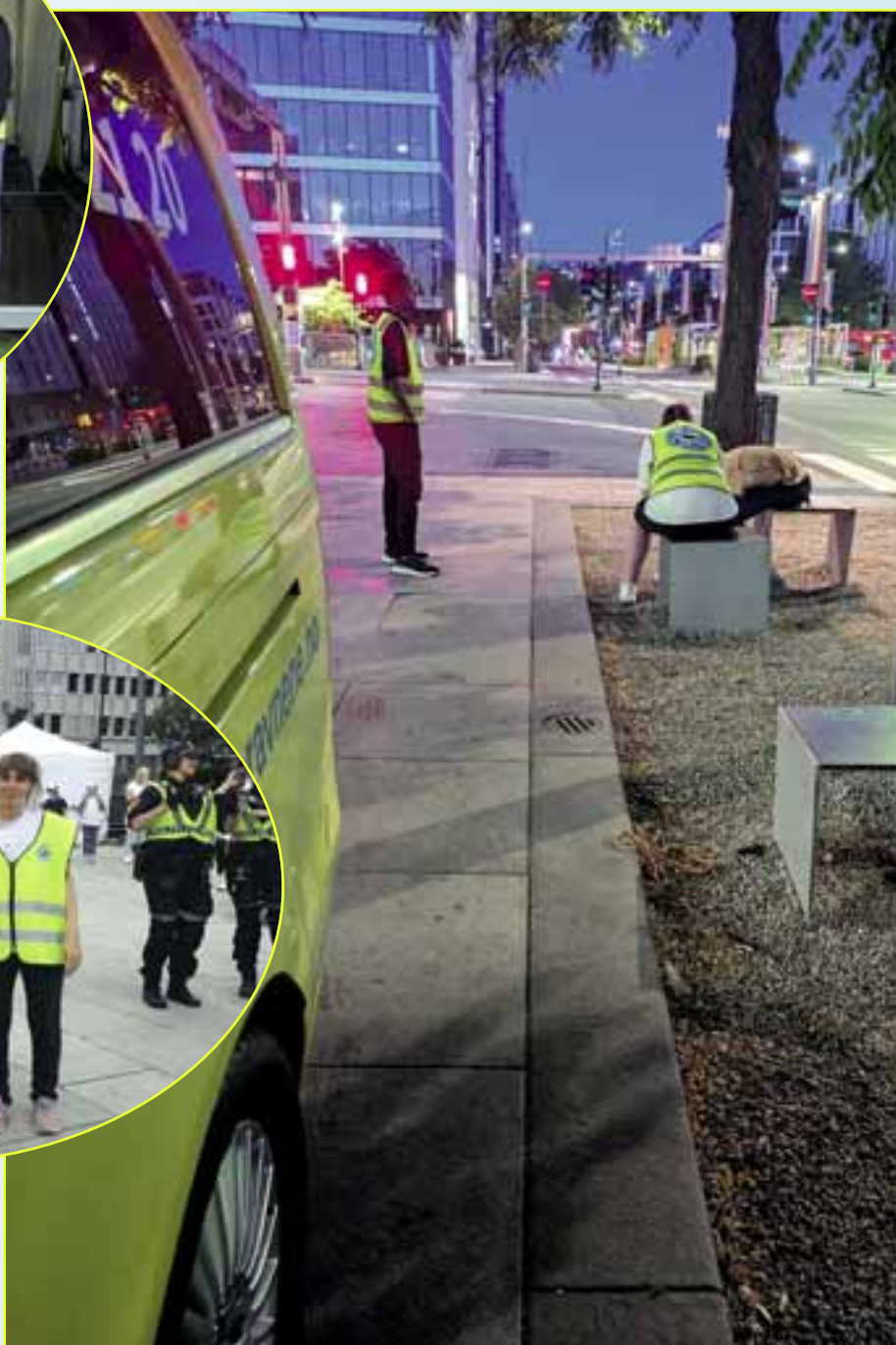
Under: SommerOslo: Trofaste, frivillige natteravnere stilte også opp i Oslo midt i juli, for å bidra til at folk hadde det bra en sommerhet natt i hovedstaden. Her gis det noen trøstende ord underveis.