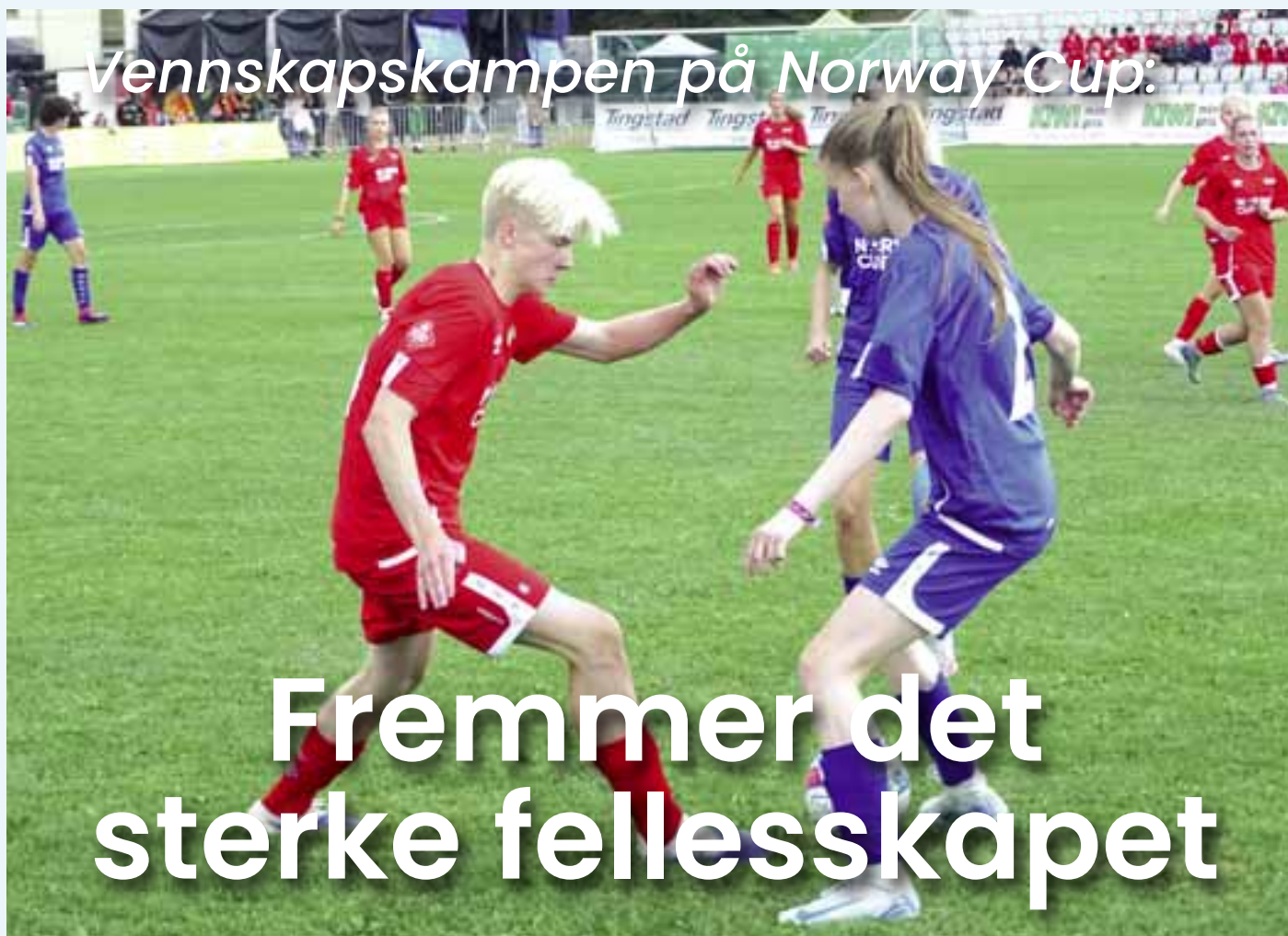
Full innsats: Ungdommen som deltok i Vennskapskampen ga alt. Norge er i rødt.

Vennskap på tvers av nasjonalitet, kjønn, alder og kultur. Det er selve kjernen i Norway Cups filosofi – noe som ikke minst kommer til uttrykk i den årlige vennskapskampen «Norge mot Verden». Her møter spillere fra ulike lag i Norge spillere fra ulike lag fra hele verden.