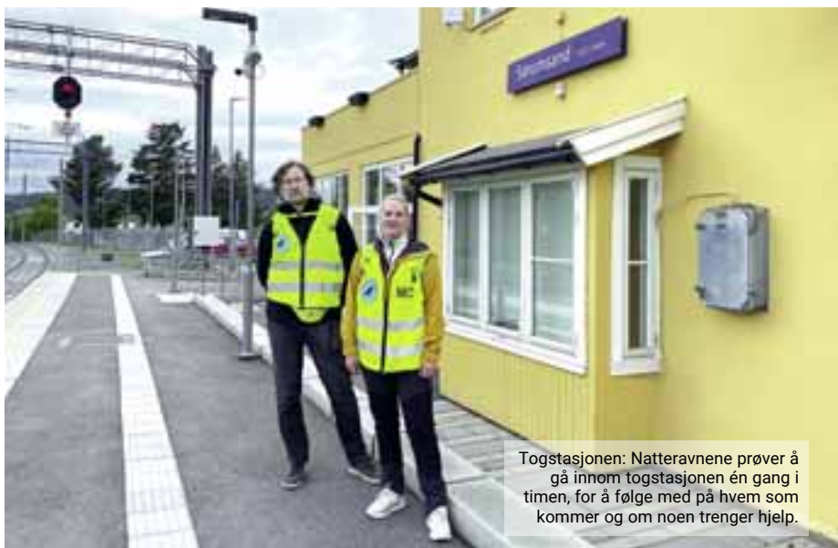
Togstasjonen: Natteravnene prøver å gå innom togstasjonen én gang i timen, for å følge med på hvem som kommer og om noen trenger hjelp.

Andre steder de er innom er skolene, barnehagene, idrettsanlegget og senteret, der en matbutikk er oppe til 23. For det meste vandrer de, men noen ganger setter de seg i bilen for å komme til stedene lengst unna. Det kommer litt an på hvor de får melding om at ting skjer.