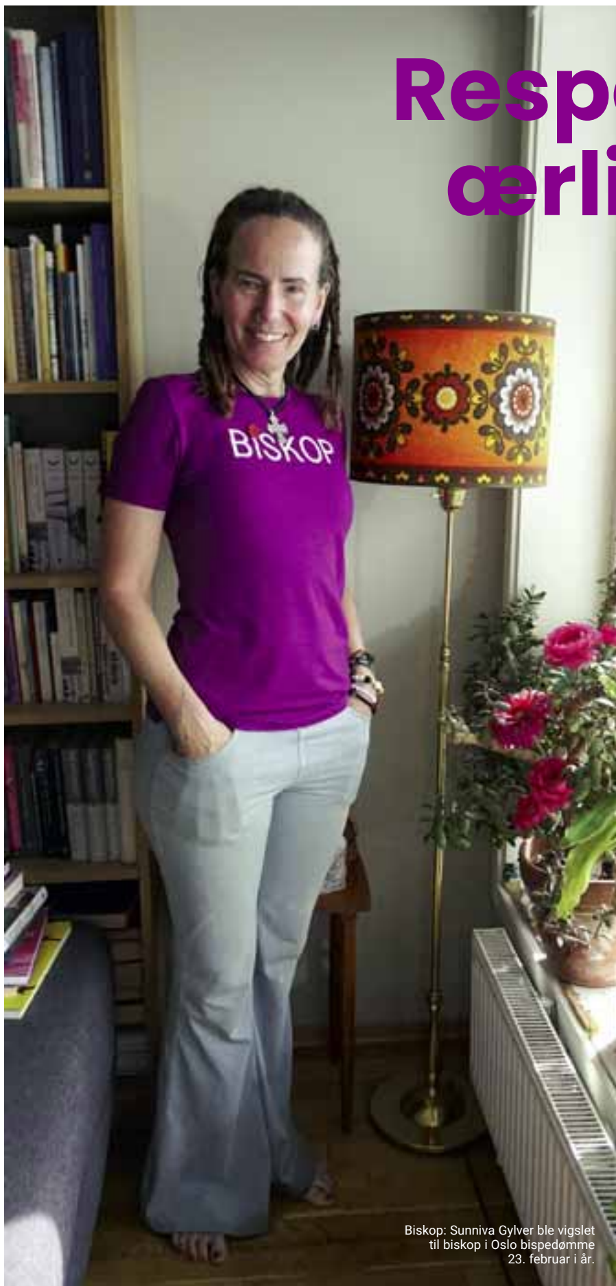
Biskop: Sunniva Gylver ble vigslet til biskop i Oslo bispedømme 23. februar i år.