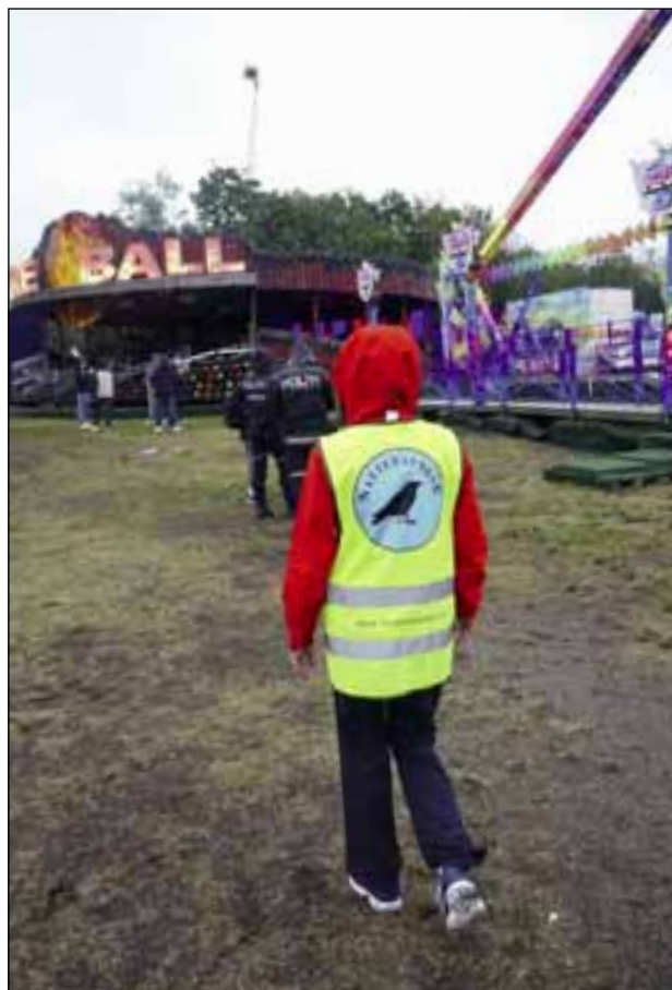
Natteravnene var også i år på Norway Cup