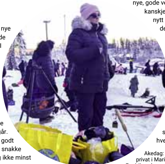
Akedag: Fra akedagen noen av natteravnene arrangerte privat i Marikollen på Rælingen.

I tillegg til i Oslo sentrum, går Renate også mye natteravn på hjemstedet Rælingen, litt utenfor Oslo. Her er det gjerne foreldre til barn på ungdomsskolen som går. Selv om de ikke kjenner hverandre veldig godt fra før, går likevel praten lett. Det er nok å snakke om med barn i omtrent samme alder – og ikke minst