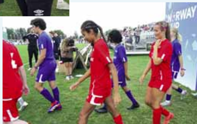
Kampstart: Spente spillerne på vei inn på banen til vennskapskampen Norge mot Verden.